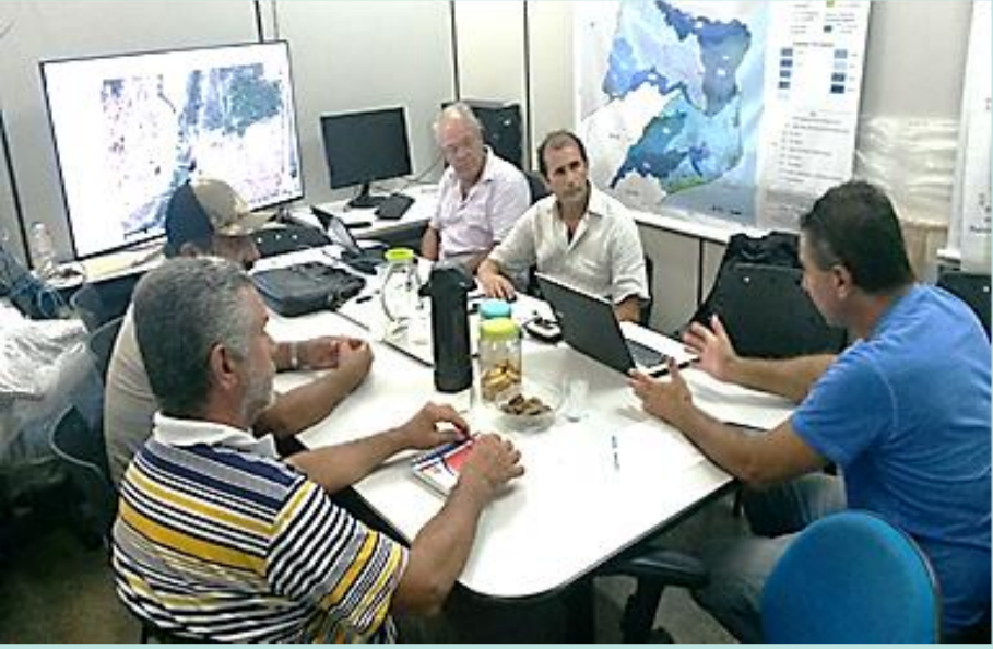
Membros do Grupo de Trabalho de Nascentes