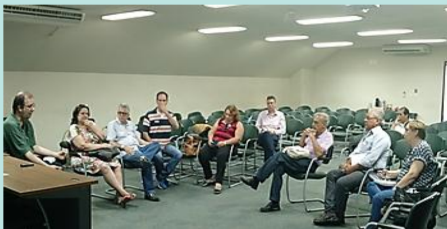
Membros do Fórum Fluminense de Comitês de Bacia Hidrográfica

A reunião ocorreu no dia 20 de fevereiro de 2017, às 10 horas, no auditório do Instituto Estadual do Ambiente (Inea), na Av. Venezuela, 110, 6º andar, no Rio de Janeiro, RJ. A reunião teve como pauta as seguintes questões: aprovação da Ata da Assembleia de 13/12/16; participação do FFCBH no FNCBH; ECOB - palestrantes; workshop; ação via MP-RJ – Custeio CBH BIG e BG; plano de trabalho FFCBH; interferência do estado na Gestão de Recursos Hídricos; além de informes.