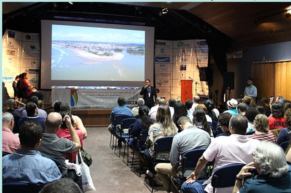
V ECOB/RJ é realizado em Paraty e reúne cerca de 300 pessoas

De 28 à 30 de agosto, a cidade de Paraty recebeu o V Encontro Estadual de Bacias Hidrográficas do Rio de Janeiro (ECOB/RJ), realizado na Casa da Cultura do município. Com o tema “Gestão Costeira e a Integração com os Recursos Hídricos”, o evento teve a participação de aproximadamente 300 pessoas, entre elas, os membros dos CBHs Baixo Paraíba do Sul e Itabapoana, Piabanha, Médio Paraíba do Sul, Guandu, Baía da Ilha Grande, Baía de Guanabara, Macaé e Rios das Ostras, Lagos São João e do Comitê Federal, o CEIVAP.