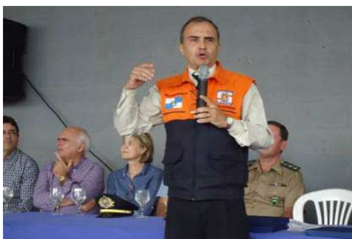
Figura 2 - Inauguração da REDEC Norte Noroeste Fluminense

Foi inaugurada no dia 09 de maio de 2012, em Itaperuna(RJ), a Coordenadoria Regional da Defesa Civil Estadual do Norte Noroeste Fluminense (REDEC IV), pelo Secretário de Estado de Defesa Civil, Coronel Sérgio Simões, que foi homenageado pelo Prefeito de Itaperuna, Fernando da Silva Fernandes, com uma placa em agradecimento aos serviços prestados ao município.