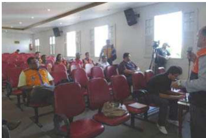
Figura 3 - Reunião da Câmara Técnica de Defesa Civil do Comitê Baixo Paraíba