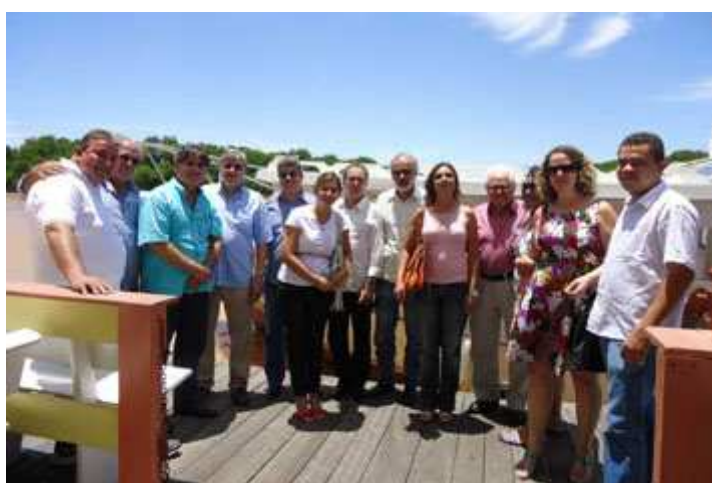
Figura 4 - 1ª Reunião do CBH Baixo Paraíba no ano de 2012

Durante a reunião, foi apresentado relatório das atividades e realizações do Comitê no ano de 2011 e, em seguida, aprovado o calendário de reuniões para o ano de 2012. Foi discutido ainda o orçamento do Comitê para 2012 e a necessidade de identificar os pontos prioritários que demandam investimentos na região abrangida pelo CBH Baixo Paraíba.