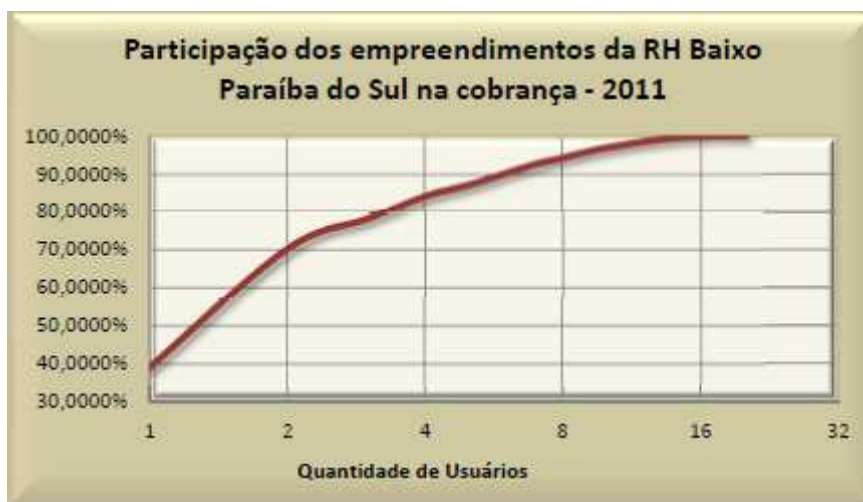
Gráfico 1 – Participação dos usuários da RH IX na Cobrança 2011

Com relação aos parcelamentos dos valores do setor de saneamento, que iniciaram em novembro de 2009 e finaliza em outubro de 2014, o valor total cobrado a título de parcelamento em 2011 foi R$ 22.360,61, relativo à concessionária CEDAE.