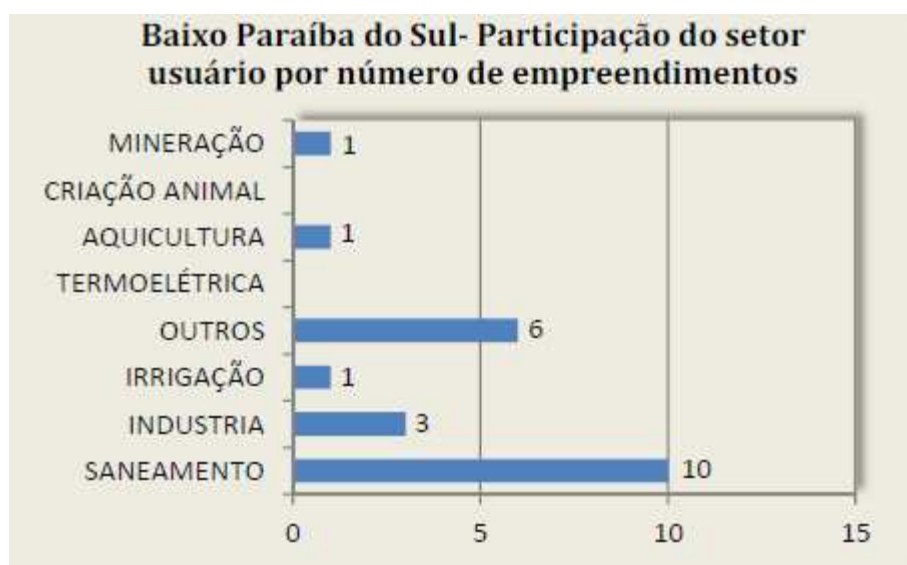
Figura 5 - Participação dos setores usuários por número de empreendimentos no sistema de cobrança na RH IX – início de 2012

O setor de mineração aparece com 1 usuário. No entanto, este empreendimento tem características industriais, e por esta razão está no sistema de cobrança. A atividade de mineração propriamente dita não tem metodologia de cobrança definida e, portanto, ainda não é cobrada nas Regiões Hidrográficas do Estado.